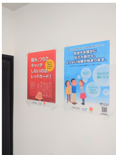
普及・啓発ポスターの掲示